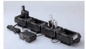
EDC-207A + EDC-207R x 3