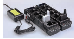
EDC-208R x 2 + EDC-162