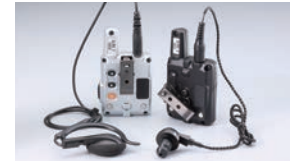
EME-67B / EME-66B