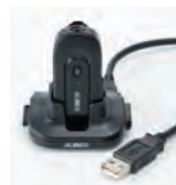
EDC-295AはUSB/USB-miniケーブル EDS-37と2AのUSBアダプター EDC-300が付属するシングル充電器セット。さらにスタンドと短い連結ケーブルが付属するEDC-295Rを3個連結して、合計4台の連結充電器としても使えます。