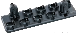
EDC-296を使えば1度に10台までのラベルトークLiteが充電できます。別売の充電セットEDC-300Kが必要です。