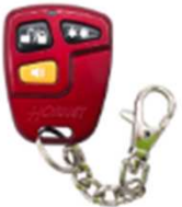
管理用リモコン (赤)