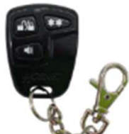
センサー用リモコン (黒)